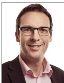
Stéphane COPPEY Président FCV / Präsident VWG Président de la commune de Monthey / Präsident der Gemeinde Monthey